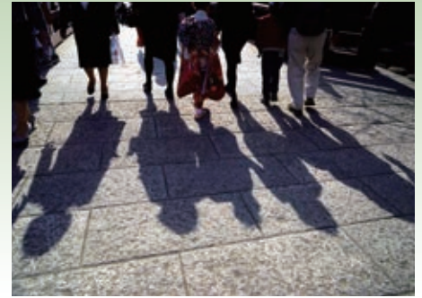
家族で祝う - 鶴岡八幡宮