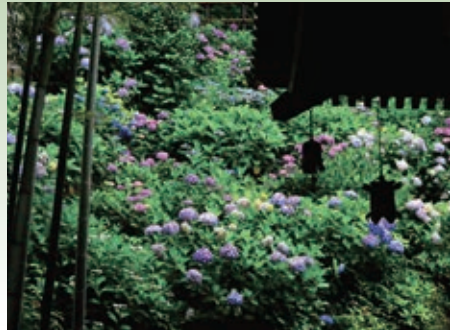
それを信じて - 長谷寺