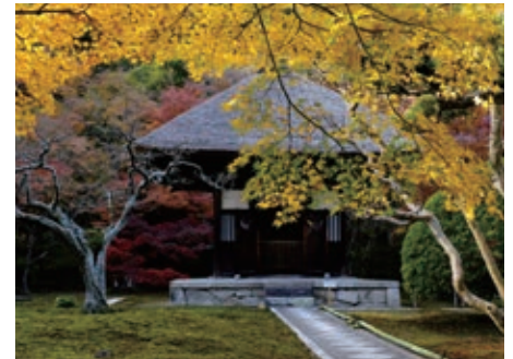
素敵な想い出 - 長寿寺

自身にとって10回目の写真展を開催するとともに、当社BeeBooks※にて6冊目の写真集を刊行した山口光彦氏。鎌倉に居を構え、50年以上にわたって鎌倉の自然に対峙し続けた作品の数々は、四季の移ろいととも彩り豊かに活写されています。また、そこに暮らすからこそその視点で人々の営みが切り取られており、優しい作品タイトルの響きとも相まって、見る者の胸に温かい火を灯してくれます。