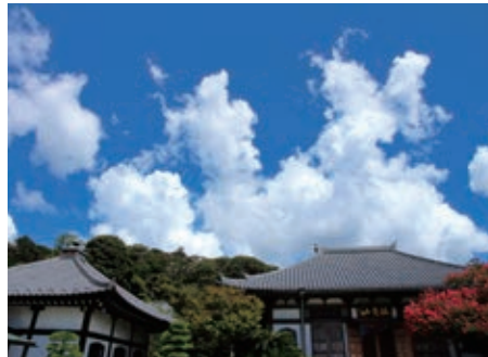
期待して - 長谷寺