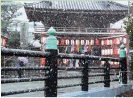
新春の雪 - 本覚寺