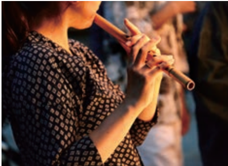
音色はどう - 鶴岡八幡宮