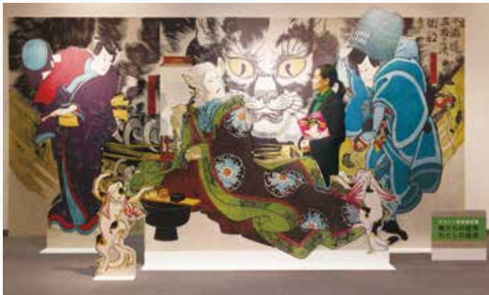
等身大の出力・パネルを使用した撮影コーナー

歌川国芳「見立東海道五拾三次岡部 猫石の由来」弘化4(1847)年 William Sturgis Bigelow Collection, 11.41806a-c