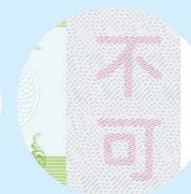
コピテクト・カラー